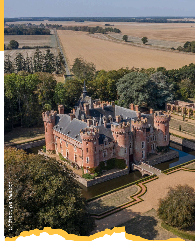
Château de Villebon